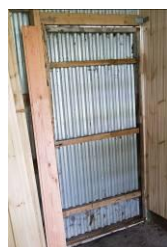
Dør i sydfacade er genmonteret.