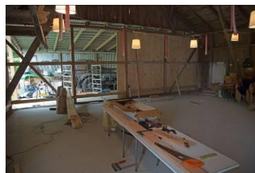
Halvdelen af den nederste del af østgavlen er færdig.