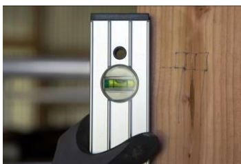
Det lykkedes at rette gavlen op.