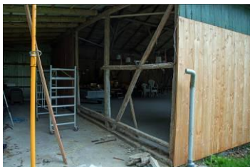
Halvdelen af østgavlens træbeklædning er fjernet.