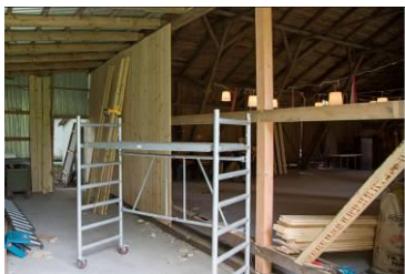
Den nye trækonstruktion.