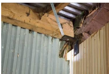
Sydøstligste hjørne, ekstra understøttelse af tagspær i maskinhus.