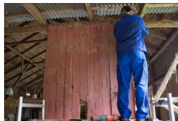
Gl. træbeklædning nedtages.