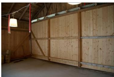
Nederste del af østgavlen er færdig.