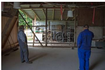
Halvdelen af østgavlens træbeklædning er fjernet.