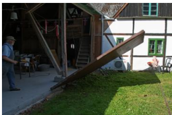
Nordvestligste stålport fjernes, 29. juli 2013