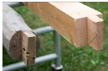
Gammelt og nyt tømmer