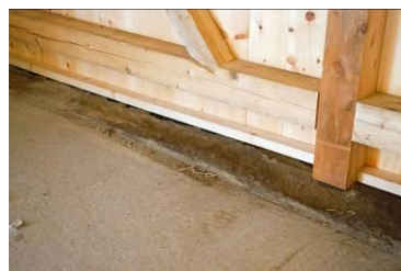
Lægteafdækning med isolering ved gulv.