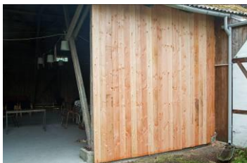
Trævæg har erstattet stålport. 30. juli 2013.