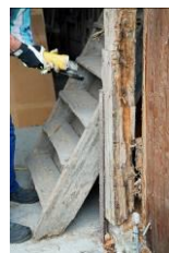
Stolpe skal fornyes