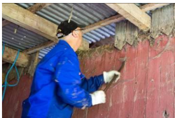
Gl. træbeklædning nedtages.