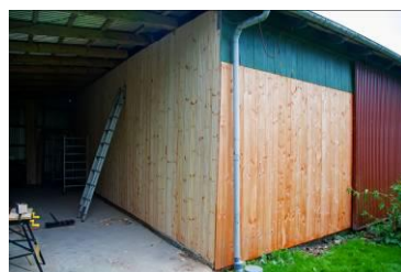
Færdig østgavl udefra.