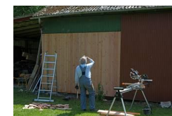
Axel besigtiger den færdige nordfacade