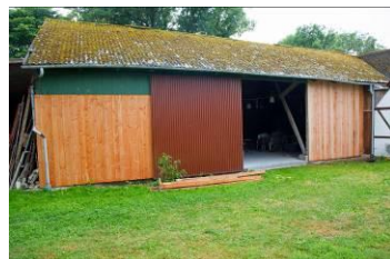
Færdig nordfacade, mgl. blot at blive malet, 30. juli 2013.