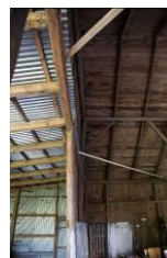
Gavlkonstruktion før opretning