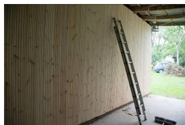
Færdig østgavl udefra.