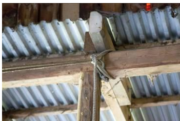
Østgavl skal rettes op ved at trækkes 15-20 cm imod vest.