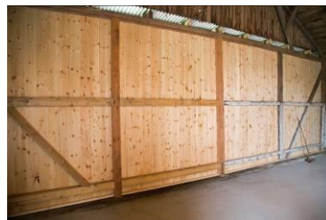
Nederste del af østgavlen er færdig.